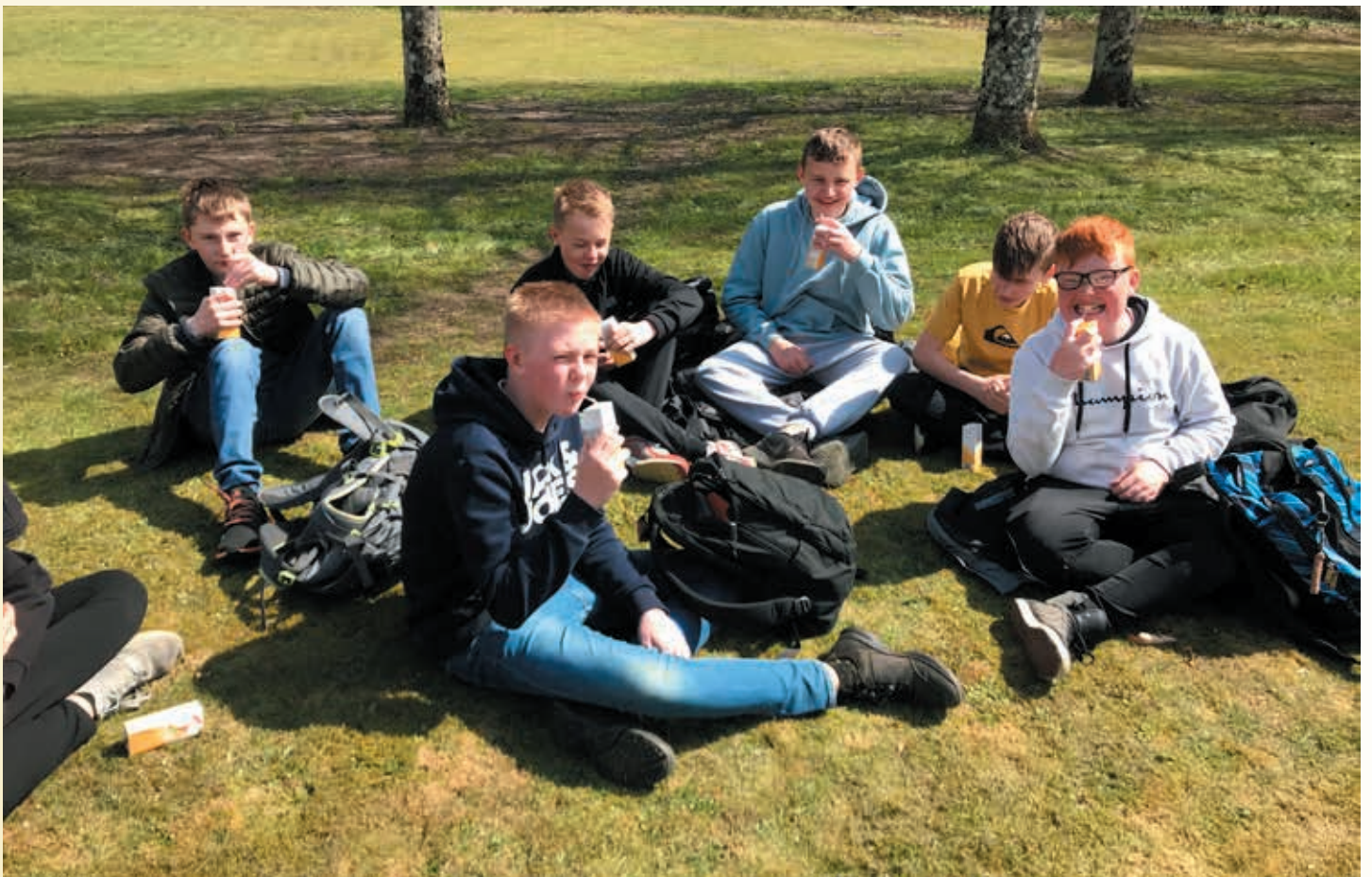
Glade konfirmander i præstegårdshaven efter flere måneders fjernundervisning. Vejret artede sig godt denne torsdag, og vi havde en god stund sammen i haven. Bageren havde bagt gulerodsboller, græsset var for en gangs skyld tørt, så konfirmanderne kunne sidde i fred og ro og nyde en godbid.