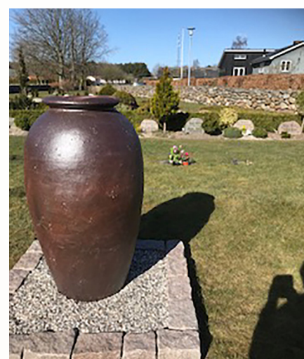
Menighedsrådet i Vester Bjerregrav har indkøbt og opsat denne krukke på urnegravpladsen på kirkegården.

Konfirmander fra Mølstrup Skole kommer med skolebussen til Klejtrup og vi mødes ved Klejtrup Kirke kl. 14:45-16:00. Konfirmanderne og jeg har en god tid i vente.