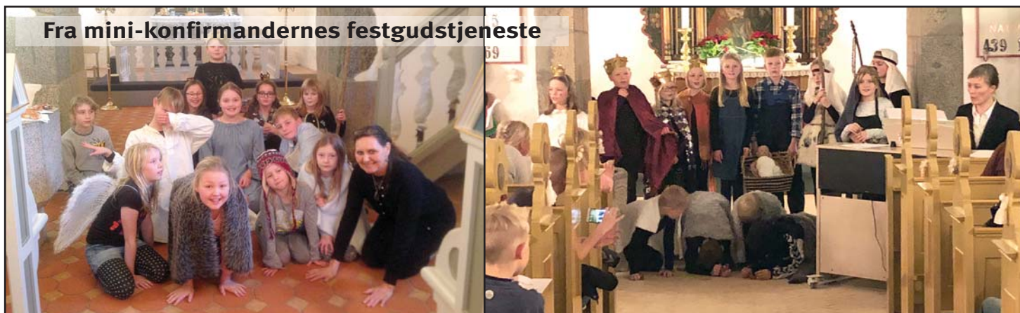
Fra mini-konfirmandernes festgudstjeneste