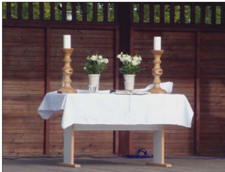
Friluftsalteret med de nye, flotte stager

På denne dejlige aften var også Klejtrup Kirkes to nye alterstager i brug for første gang. Trædrejerne i Klejtrup har foræret Klejtrup menighedsråd to nye alterstager drejet i træ.